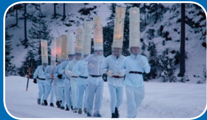
am 5. Jänner in Wildalpen und Hinterwildalpen