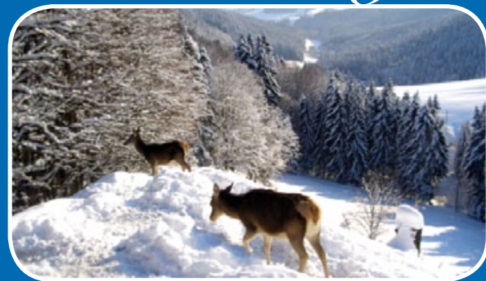
Die staade Zeit ist da!